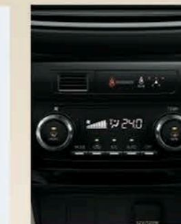
Climatisation automatique bizona