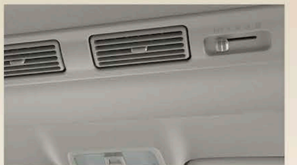
Grille d'aération de la climatisation placée dans le plafond arrière