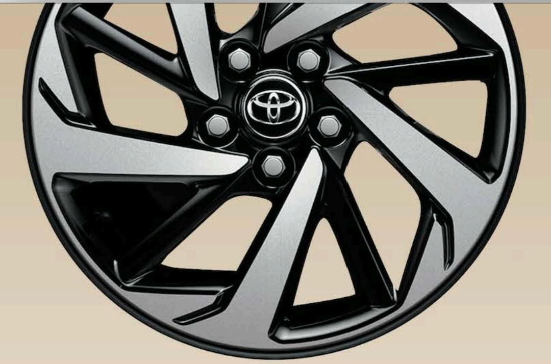
Jantes alliage 17"

Des équipements exceptionnels, pour une conduite agréable