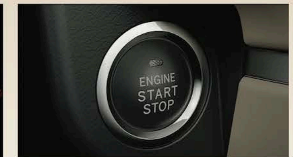
Système SMART KEY Ouverture et démarrage sans clef