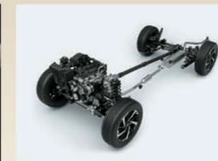
Roues motrices arrière