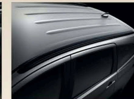
Barres de toit intégrées