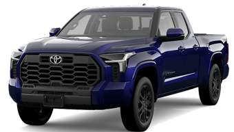
Dark Blue MC. (8X8) *