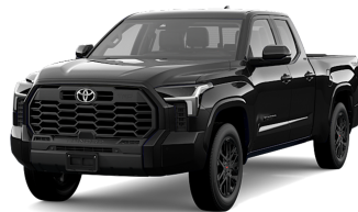
Attitude Black MC. (218) *