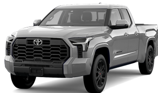
Silver ME. (1J9) *