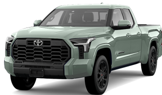
Urban Khaki (6X3)