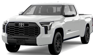
Super White (040)