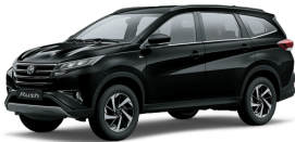
Black ME. (X12) *