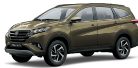
Bronze M.M. (4T3) *