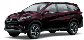
Dark Red MC. (R54) *