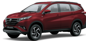
Dark Red M.M. (3Q3) *