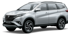
Silver M.M. (1E7) *