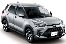
Silver ME. (S28) *