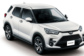
White Pearl (W25) *