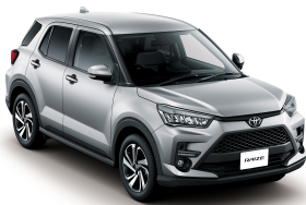
Silver ME. (S28) *