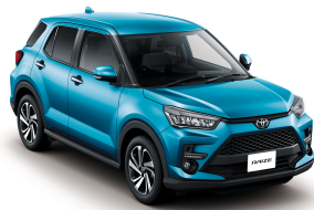
Turquoise M.M. (B86) *