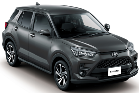
Grey ME. (1G3) *