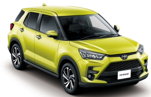
Yellow SE. (Y13) *